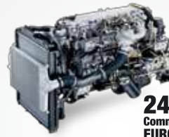
240PS Common Rail EURO 3